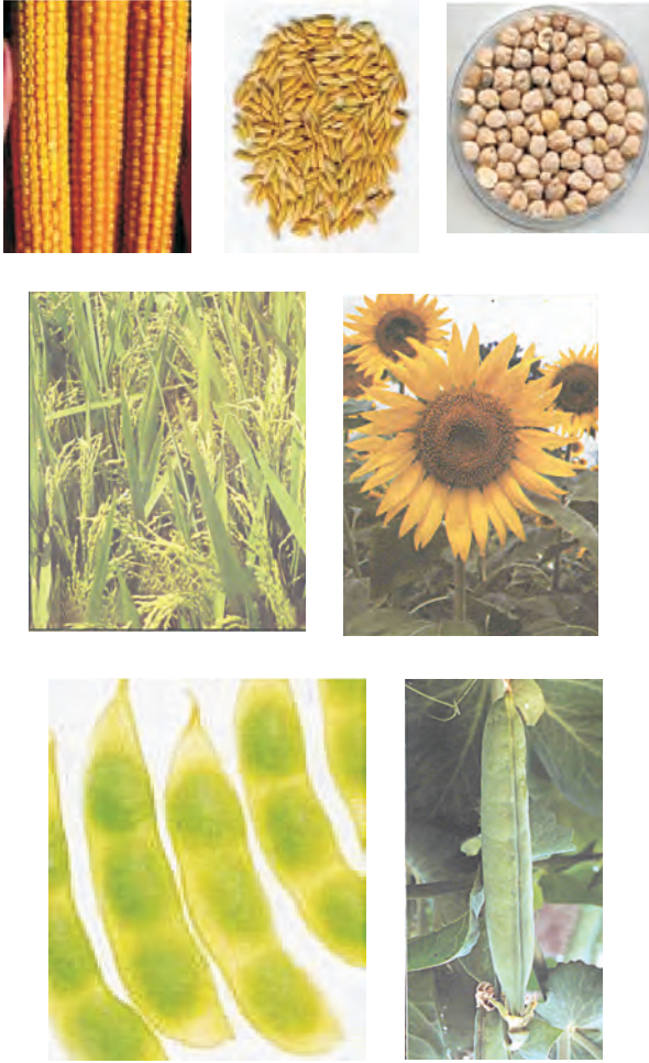
चित्र 15.1: विभिन्न प्रकार की फसलें

ऊर्जा की आवश्यकता के लिए अनाज; जैसे-गेहूँ, चावल, मक्का, बाजरा तथा ज्वार से कार्बोहाइड्रेट प्राप्त होता है। दालें जैसे चना, मटर, उड़द, मूँग, अरहर, मसूर से प्रोटीन प्राप्त होती है और तेल वाले बीजों; जैसे-सोयाबीन, मूँगफली, तिल, अरंड, सरसों, अलसी तथा सूरजमुखी से हमें आवश्यक वसा प्राप्त होती है (चित्र 15.1)। सब्जियाँ, मसाले तथा फलों से हमें विटामिन तथा खनिज लवण, कुछ मात्रा में प्रोटीन, वसा तथा कार्बोहाइड्रेट भी प्राप्त होते हैं। चारा फसलें; जैसे-वर्सीम, जई अथवा सूडान घास का उत्पादन पशुधन के चारे के रूप में किया जाता है।