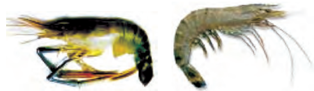
मेक्रोब्रेकियम रोजेन वर्गी (ताज़ा पानी)

भविष्य में समुद्री मछलियों का भंडार (stock) कम होने की अवस्था में इन मछलियों की पूर्ति संवर्धन के द्वारा हो सकती है। इस प्रणाली को समुद्री संवर्धन (मेरीकल्चर) कहते हैं।