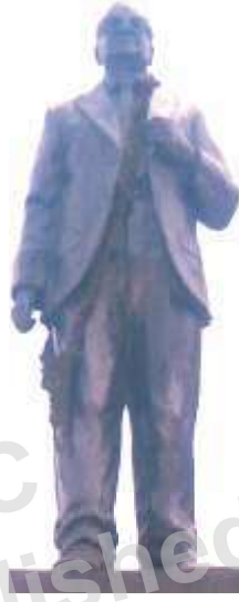
होनहार बालक सर शिव सागर राम गुलाम