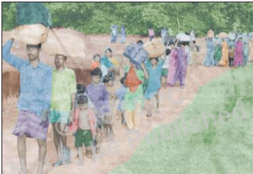
कोसी में बाढ़ के चलते पलायन करते हुए मजदूर

इसी संदर्भ में वर्तमान में बिहार के आर्थिक विकास का कार्यक्रम सराहनीय है। मुंबई में बिहारियों (जिन्हें उपेक्षा के रूप में 'भैया' कहा करते हैं) पर किये गए अत्याचार के बाद बिहार के मुख्यमंत्री श्री नीतीश कुमार का यह वक्तव्य काफी महत्व रखता है जिसमें उन्होंने कहा था—“जो भी बिहारी मजदूर अन्य राज्यों में चले गए हैं वे पुनः बिहार में चले आएँ। उन्हें काम की कमी नहीं होने दी जाएगी। सरकार उनके साथ अच्छा वर्ताव करेगी।” इस वक्तव्य का असर अन्य राज्यों में रह रहे बिहारी मजदूरों पर गहरा पड़ा और वे अपनी जन्मभूमि की ओर लौटने लगे। खुशी की बात है कि अब कुछ दिनों में बिहार के मजदूरों के चेहरे पर मुस्कान देखने को मिलेगा।