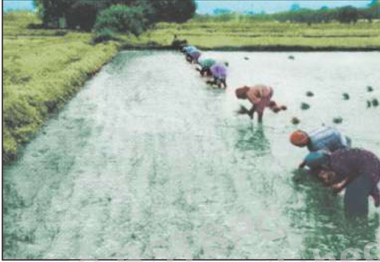
खेत में धान की रोपनी करते कृषक मजदूर

हम देख रहे हैं कि इस चित्र 6.1 में कुछ ग्रामीण महिलाएँ एक साथ मिलकर धान रोपनी का काम कर रही हैं। ये सारी महिलाएँ कृषक मजदूर के रूप में अपने-अपने परिवार के जीविकोपार्जन के लिए बड़े किसानों के खेत में काम कर रही हैं। अर्थात् ये ऐसे कृषक मजदूर हैं जो बिल्कुल ही भूमिहीन हैं जिनकी बाध्यता है कि ये मजदूरी करके ही पेट का पालन करें।