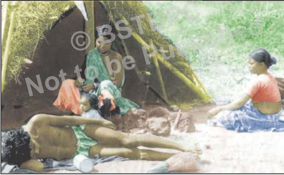
कृषक मजदूरों की दशा

चित्र 6.2 से बिहार में कृषक मजदूरों की अवस्था का पता चलता है। यह स्पष्ट करता है कि बिहार के कृषक मजदूरों की हालत काफी दयनीय है।