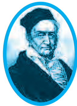
कार्ल फ्रैड्रिक गॉस (1777 – 1855)

अंकगणित की आधारभूत प्रमेय के रूप में विख्यात होने से पहले, प्रमेय 1.2 का संभवतया सर्वप्रथम वर्णन यूक्लिड के एलीमेंट्स की पुस्तक IX में साध्य (proposition) 14 के रूप में हुआ था। परंतु इसकी सबसे पहले सही उपपत्ति कार्ल फ्रैड्रिक गॉस (Carl Friedrich Gauss) ने अपनी कृति डिसक्विशंस अरिथिमेटिकी (Disquisitiones Arithmeticae) में दी। कार्ल फ्रैड्रिक गॉस को प्रायः 'गणितज्ञों का राजकुमार' कहा जाता है तथा उनका नाम सभी समयकालों के तीन महानतम गणितज्ञों में लिया जाता है, जिनमें आर्किमिडीज़ (Archimedes) और न्यूटन (Newton) भी सम्मिलित हैं। उनका गणित और विज्ञान दोनों में मौलिक योगदान है।