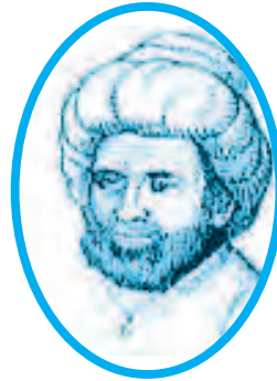
मुहम्मद इब्न मूसा अल-ख्वारिज़्मी (780 – 850 सा.यु.)

प्रमेयिका एक सिद्ध किया हुआ कथन होता है और इसे एक अन्य कथन को सिद्ध करने में प्रयोग करते हैं।