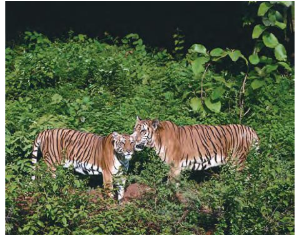
चित्र 1.3 भारत के विभिन्न चिड़ियाघरों में वन्य प्राणी