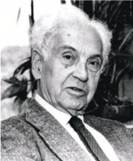
एरनस्ट मेयर (1904 - 2004)

एरनस्ट मेयर का जन्म 5 जुलाई, 1904 में केंपटन, जर्मनी में हुआ था। आप हावर्ड विश्वविद्यालय के विकासपरक जीव वैज्ञानिक थे, जिन्हें '20वीं शती का डार्विन' कहा गया। आप अब तक के 100 महान वैज्ञानिकों में से एक थे। मेयर ने सन् 1953 में हावर्ड विश्वविद्यालय की कला एवं विज्ञान संकाय में नौकरी प्राप्त की और 1975 में एलेक्जेंडर अगासीज प्रोफ़ेसर ऑफ़ जुलोजी एमीरिटस की पदवी के साथ अवकाश प्राप्त किया। अपने 80 सालों के कार्य जीवन में आपका पक्षी-विज्ञान, वर्गीकरण-विज्ञान, प्राणि-भूगोल, विकास, वर्गिकी तथा जीव विज्ञान के इतिहास एवं दर्शन आदि पर अनुसंधान केंद्रित रहा। आप ने लगभग अकेले ही विकासीय जीव विज्ञान के केंद्रीय प्रश्न जाति विविधता की उत्पत्ति को खड़ा किया, जो कि आज सच है। इसके साथ ही आपने हाल ही में स्वीकृत जीव वैज्ञानिक जाति वर्गिकी की परिभाषा की अगुवाई की। मेयर को तीन पुरस्कार दिए गए, जिन्हें व्यापक तौर पर जीव विज्ञान के तीन ताजों की संज्ञा दी जाती है: 1983 में बालजॉन प्राइज, 1998 में जीव विज्ञान के लिए इंटरनेशनल प्राइज और 1999 में क्राफ़र्ड प्राइज। मेयर ने 100 वर्ष की आयु में 2004 को स्वर्गवासी हुए।