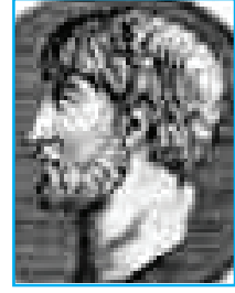
पियरे डि फर्मा (1601–1665) आकृति 15.2